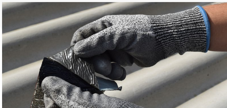
Etertape Fita Multiúso

A Etertape Fita Multiúso atende os requisitos da norma técnica ABNT NBR 16411 – Fita asfáltica autoadesiva.