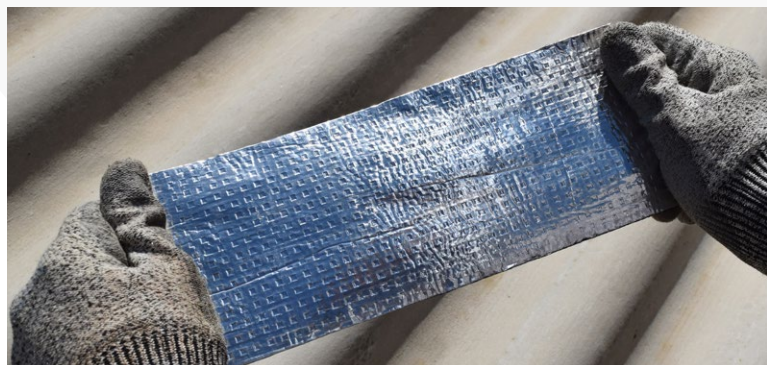
Produto pronto para aplicação