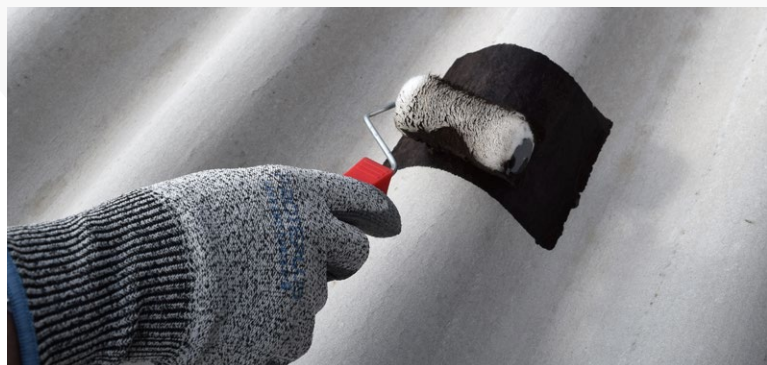
Produto durante a aplicação